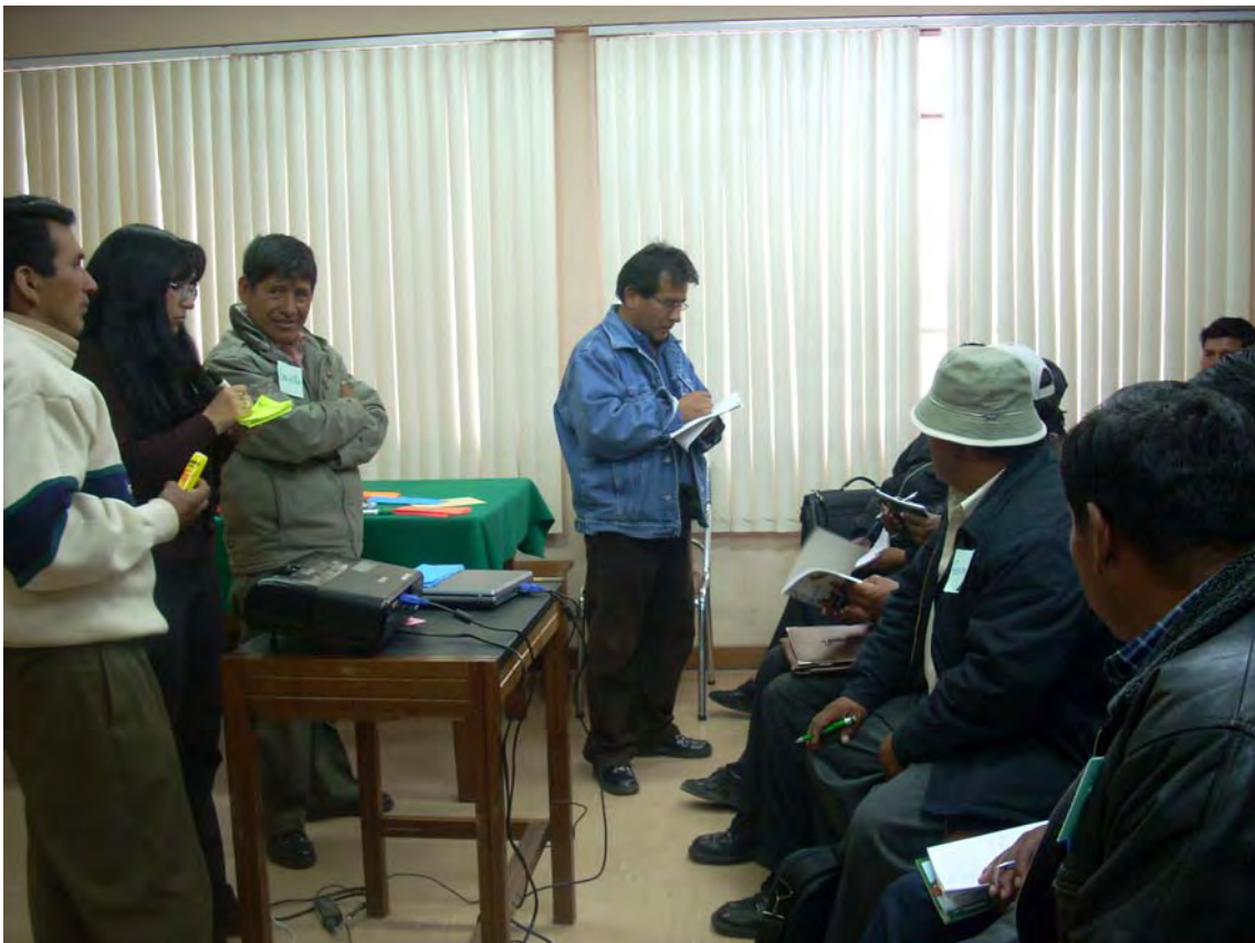
SEGUNDO TALLER REGION DEL LAGO TITIKAKA