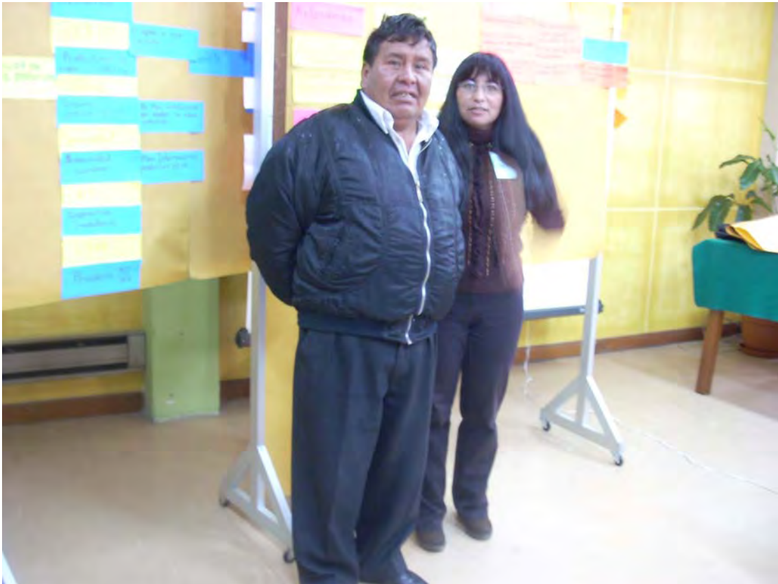
PRIMER TALLER REGION DEL LAGO TITIKAKA