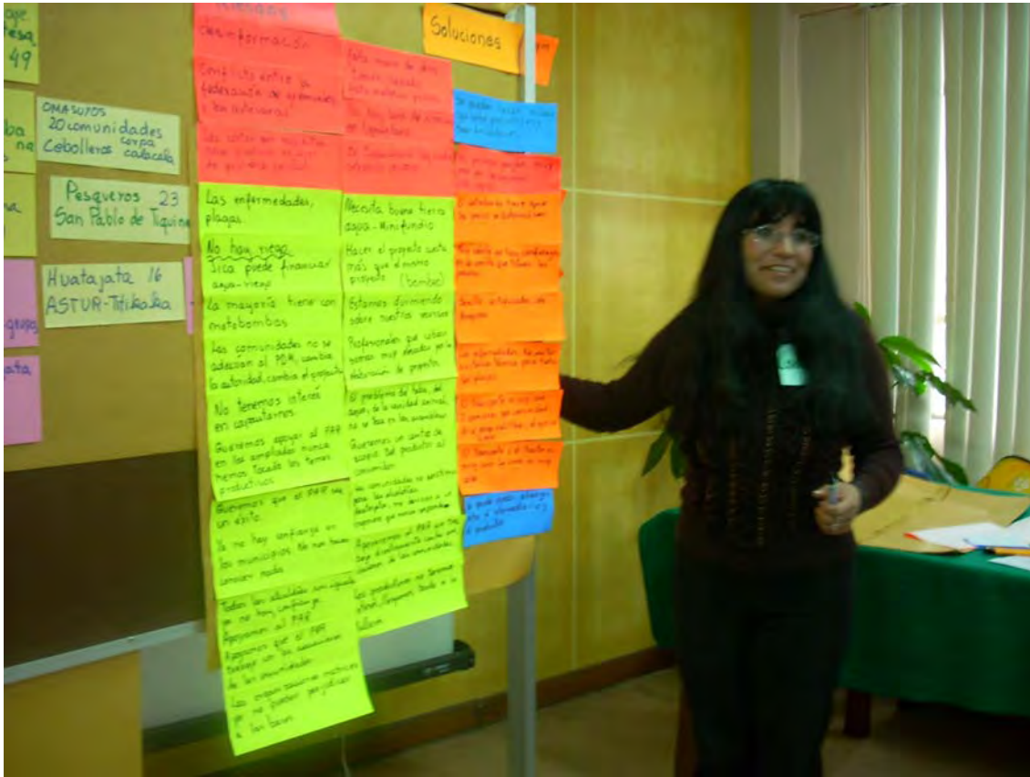
SEGUNDO TALLER REGION DEL LAGO TITIKAKA