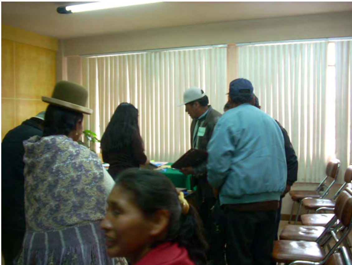
SEGUNDO TALLER REGION DEL LAGO TITIKAKA