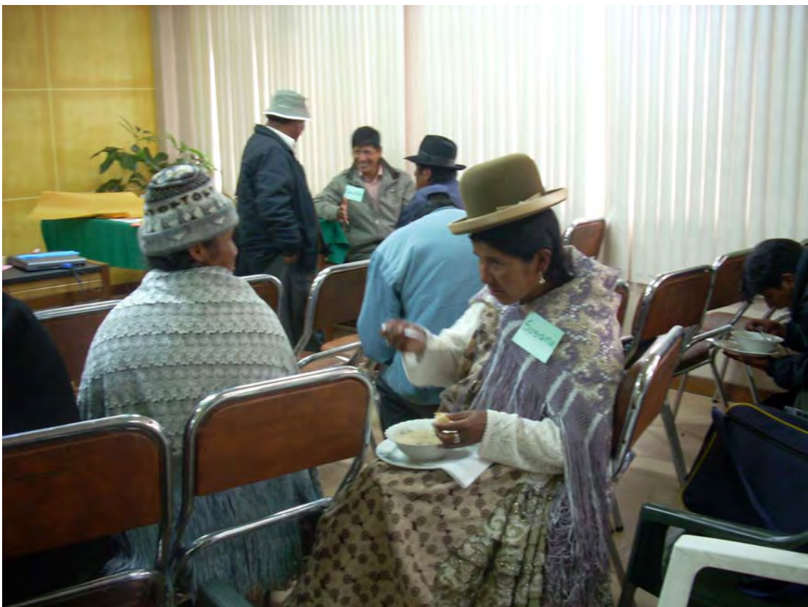
PRIMER TALLER REGION DEL LAGO TITIKAKA