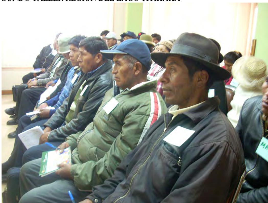
SEGUNDO TALLER REGION DEL LAGO TITIKAKA