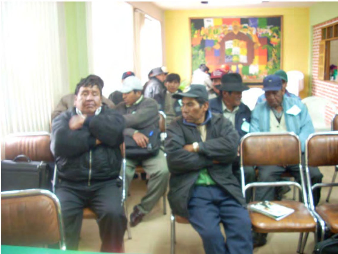
SEGUNDO TALLER REGION DEL LAGO TITIKAKA