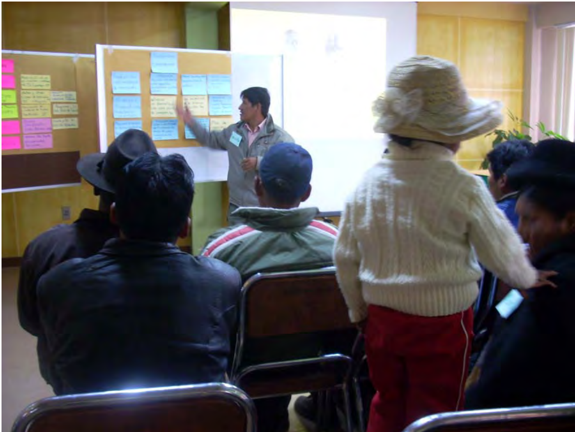
SEGUNDO TALLER REGION DEL LAGO TITIKAKA