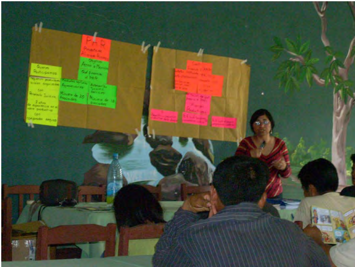
TALLER CON PUEBLOS INDIGENAS REGION NORTE DE LA PAZ