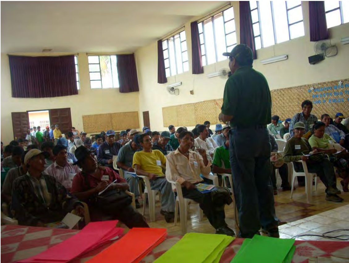
SEGUNDO TALLER REGION NORTE DE LA PAZ