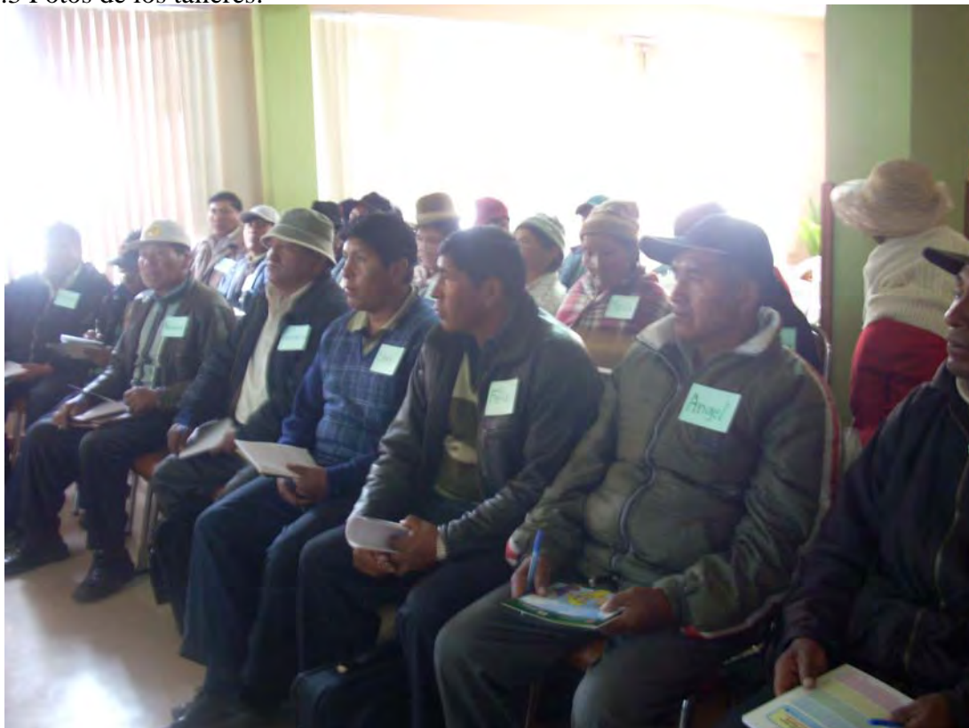
SEGUNDO TALLER REGION DEL LAGO TITIKAKA