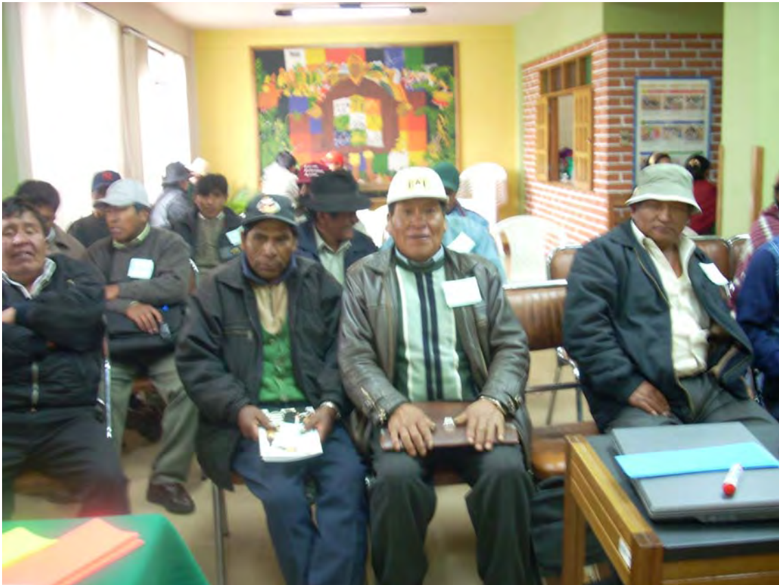
PRIMER TALLER REGION DEL LAGO TITIKAKA